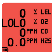
Красная подсветка дисплея при срабатывании сигнализации