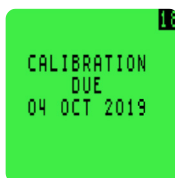
Настраиваемые параметры калибровки